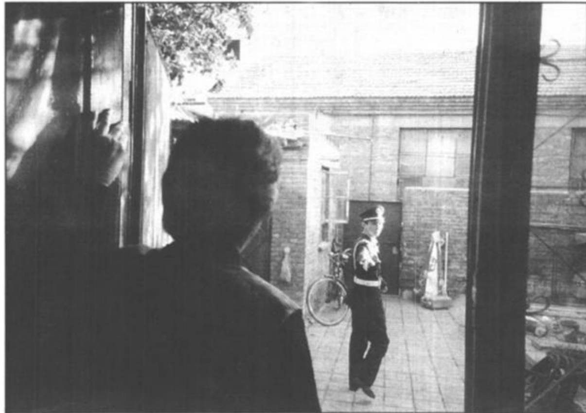
清晨，儿子要去上岗了，母亲总是带着几分牵挂