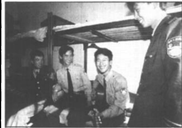
战友之间亲如兄弟，再大的困难也难不住这伙硬汉子